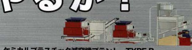
ケミカルプラスチック減容機プラント TYPE B