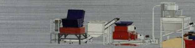
ケミカルプラスチック減容機プラント TYPE E