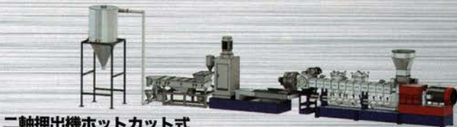
二軸押出機ホットカット式