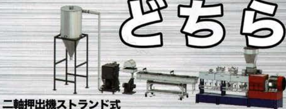
二軸押出機ストランド式